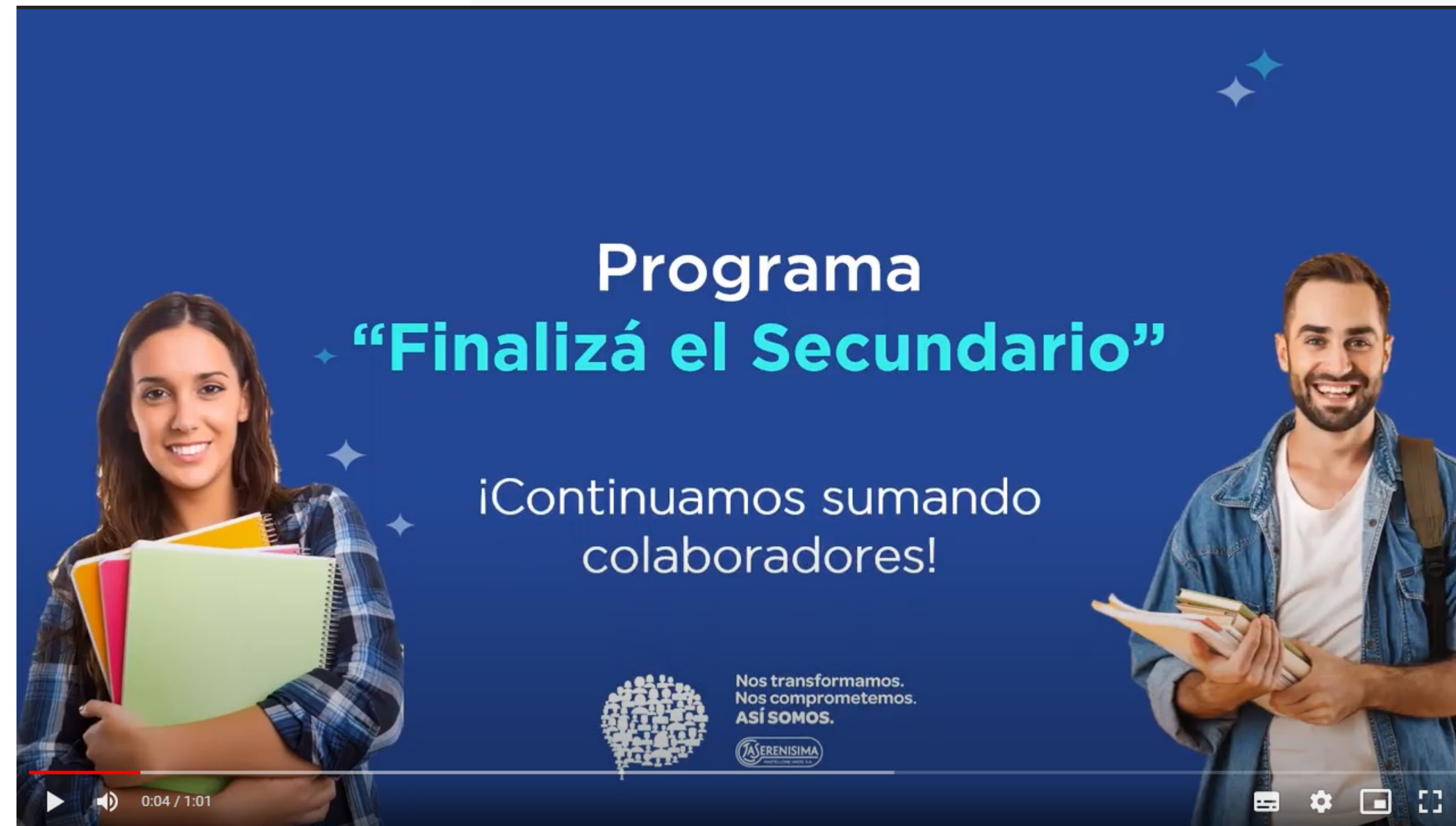
Programa Finalizó el Secundario (Video)